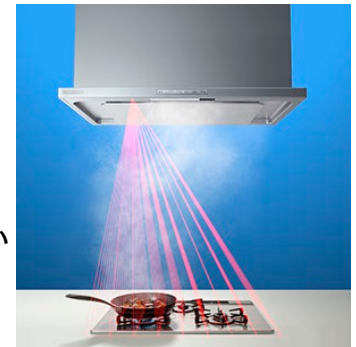
風量おまかせ運転 温度センサー照射イメージ

レンジフードは油煙量によって風量を調整する必要がありますが、どれくらいの風量が適切なのかがわからなかったり、調理状況にあわせて風量を変更することが面倒だと感じたりする人もいます。「風量おまかせ運転」は、レンジフードに搭載した8×8の複眼タイプの温度センサーで調理状況を検知することにより、3段階の風量レベルを自動でコントロールする機能です。油煙が多く発生しやすい高温調理を検知したときは「強運転」、油煙が少ない低温調理を検知したときは「弱運転」で静かに油煙を吸い、快適な調理空間を実現します。また、効率よく油煙をキャッチし必要以上に風量をあげないので、強運転のみで調理した場合と比べて消費電力の削減にも繋がります。